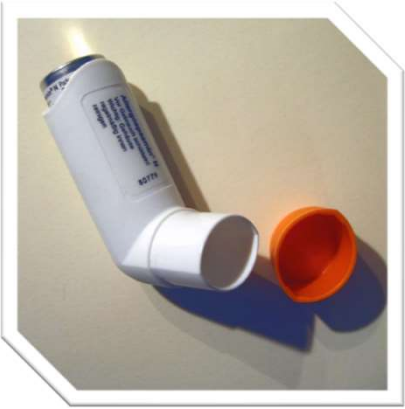
Bild: Wikipedia This file is licensed under the Creative Commons Attribution-Share Alike 3.0 Unported license.